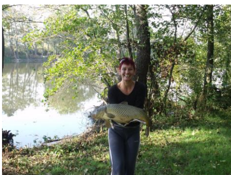
Kemény küzdelem eredménye ez a szép ponty