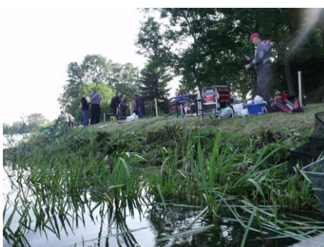
Háziverseny a pácini karsán